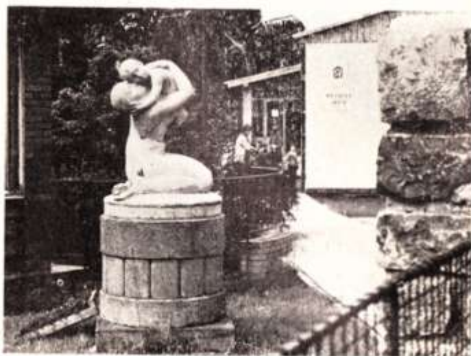
Matka s dítětem před novou mateřskou školou (J. Hladík)

s mohutnou pergolou. Z terasy jsou přístupné obytné místnosti vily, především obývací pokoj (28 m 2 ) a jídelna (19 m 2 ). Centrálním komunikačním prostorem domu je hala se schodištěm a galérií.