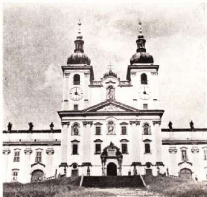
Chrám Navštívení P. Marie

bylo ovšem nic změněno. Naopak, jako dominanta byla vyzvednuta horizontální linie hlavní římsy, zdůrazněná na průčelí chrámu tympanonem a na rezidencích atikou se čtrnácti soškami světců v nadživotní velikosti. Dochované dobové pohledy na západní průčelí kopcekého barokního monumentu jednoznačně dokládají popsaný vývoj změny jeho tvárnosti. Dnešní vzhled vděčí za sjednocení vertikální pravidelné rytmičnosti polopilastrů, přičemž je tento rytmus zcela podřízen klidové horizontální linii hlavní římsy zdůrazněné atikami a centrálním tympanonem. Sevřenost kompozice prokazuje jednoznačně dr. V. Kupka.