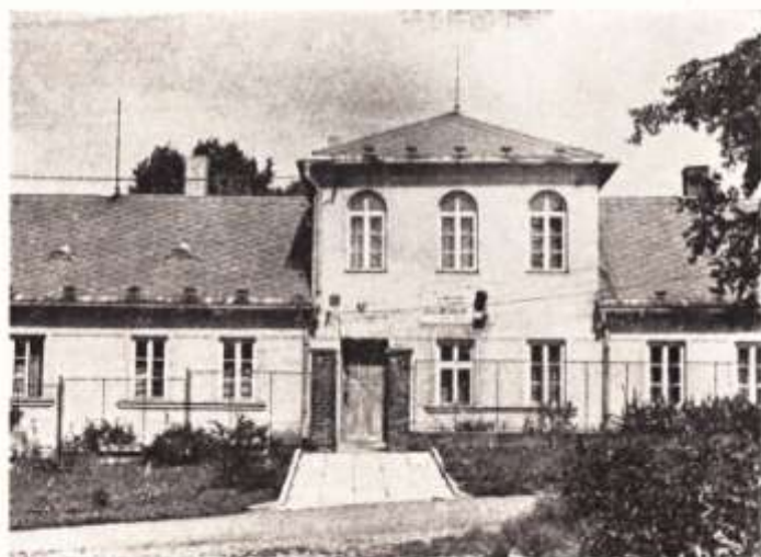
Dům „Na krásné vyhlídce“

Takto nazývaný dům č. 38 v ulici St. Krejčího si ponechal alespoň základní rysy své klasicistní dispozice, uplatněné vhodně při jeho řádovém začlenění v ulici (hlavní římsa, tvar vikýřů, ostění oken, lezény,