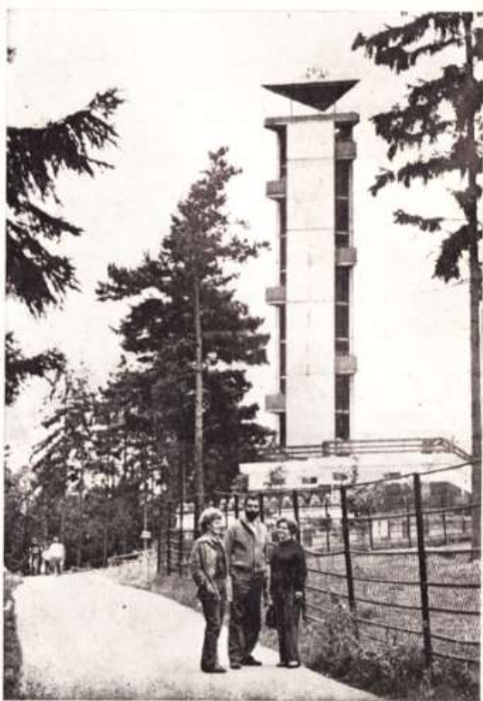
Vyhlídková věž v ZOO

Pro srovnání: v zoo Brno bylo v r. 1980 chováno 614 kusů zvíře ve 192 druzích; ostravská zoo chovála ve stejném roce 750 exemplářů ve 150 druzích. V roce 1974 byla olomoucká zoo na 11. místě ze 13 československých zoologických zahrad, v roce 1980 již na 6. místě z 15 zoologických zahrad v Československu. K nejzajímavějším zvířatům chováaným v zoo na Kopečku patří tygři — sumatránský a sibířský, kančík horský, zubr evropský a zebra Grévyho. K ohroženému druhu patří žirafa