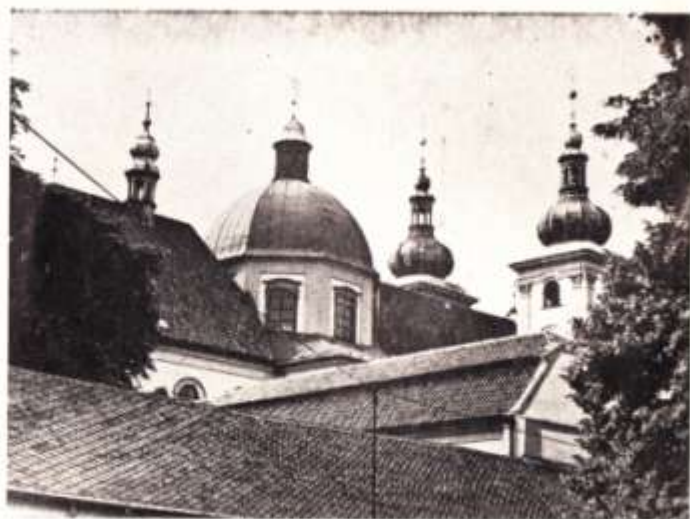
Kopecké věže od severovýchodu