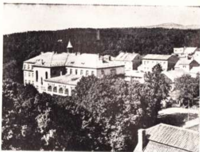
Detický ústav pro nápravu vad sluchu