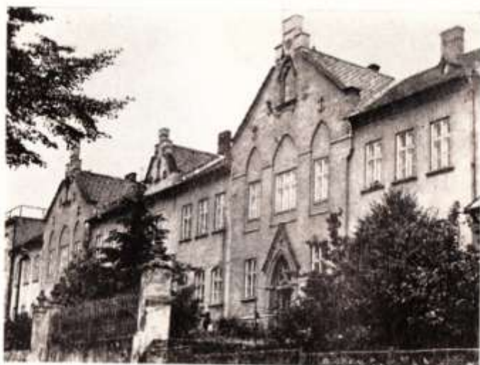
Budova dnešní školy

ta vše volně a v náznaku připomíná anglickou tudorovskou novogotiku. Dochoval se pohled na levou starší část budovy z doby před stavbou. Byla to budova postavená ve slahu klasicistními s obdélnou atikou a mansardovou střešou centrální části. Je škoda, že se nedochovala. Budovu školy (zprvu č. 70) vlastnila od r. 1883 kongregace sester třetího řádu sv. Františka, která zde zřídila „Opatrovnu malých dětí“. V levém rizalitu se nacházela kaple o půdorysu 103,5 m 2 .