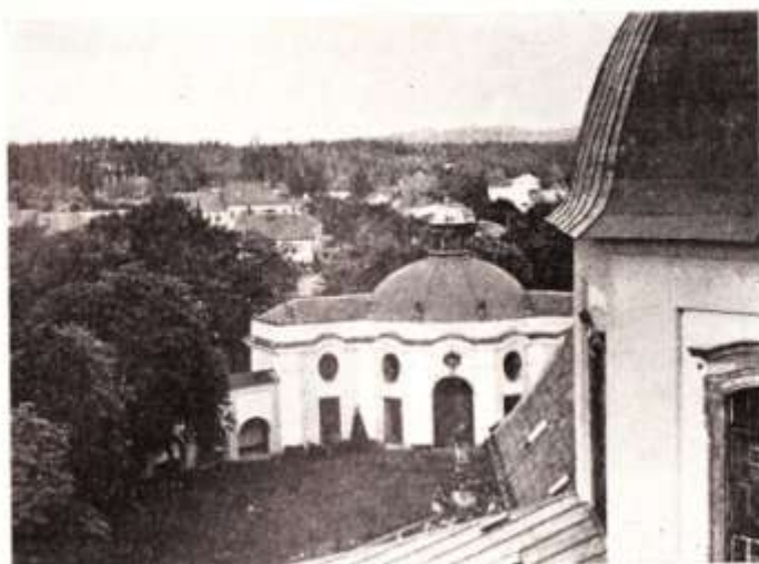
Pohled z věže na kapli sv. Anny v ambitech